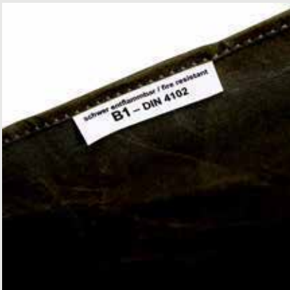
hochwertiges Baumwollgewebe B1 - schwer entflammbar