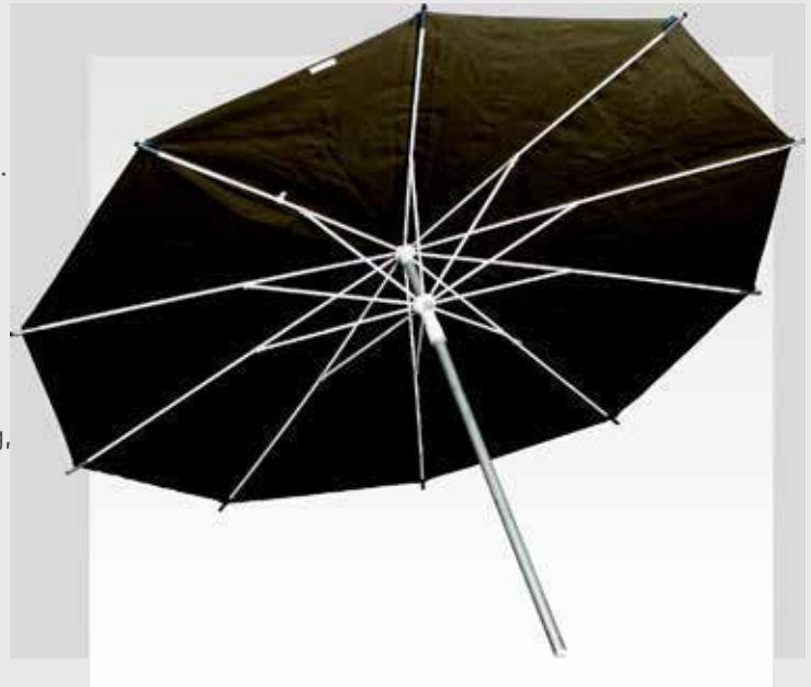
Typ „Standard plus“