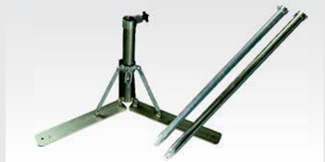
verfügbar mit Erdspeiss und Klappständer