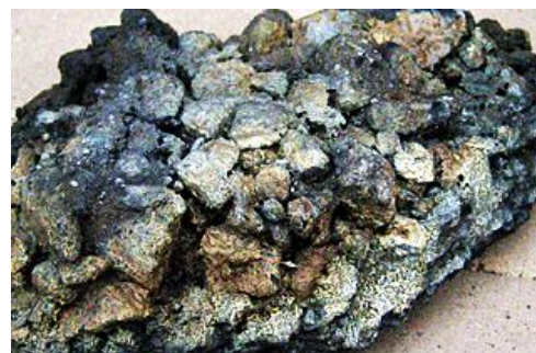
PAK-Gehalt > 150ppm